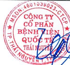
Hoàng Tuyên Chủ tịch Hội đồng Quản trị